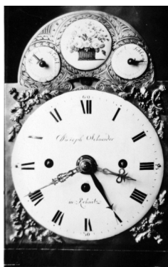
Schneider József rohonci mester klasszicista szekrényóra szerkezete az 1770-es évekből