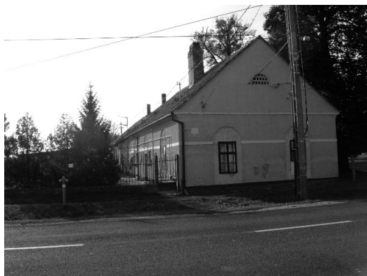
Az izsákfai Somogyi-kúria*

Az unoka pedig Somogyi Ádám kuruc ezredes, Rákóczi Ferenc hűséges híve, alispán és táblabíró. 5 Az első házasságából nem született gyermeke. Felesége fiatalon meghalt.