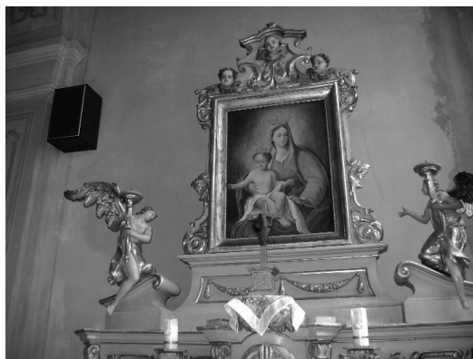
Az alsósági Kresznerics-Madonna oltára