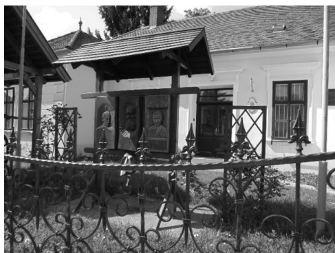
A három híres tanító portré-domborműve a községháza előkertjében

A községháza előkertjében álló „triptichon” alakjai három tanítónak állítanak emléket.