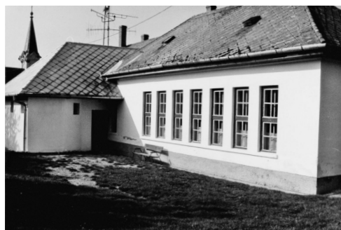
Az 1938-ban épült tanterem (a bal oldalt kiugró rész az 1996-ban hozzáépített vizesblokk)