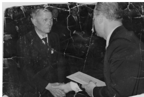
A kitüntetést átadja Losonczy Pál, az Elnöki Tanács elnöke

A nyugdíjazás azonban csak a néptanító munkájára vonatkozott. Hiszen az evangélikus gyülekezet által fenntartott iskola tanítója kántor is volt, 1905-től szinte élete végéig. Gyermekkoromban ott húztuk mögötte, a templom karzatán, a szószékkal szemben lévő műemlék értékű orgona két szíját. Mára a sípládát motor tölti fel levegővel, de a múlt század közepén ezt még a szíjak húzogatóásával lehetett elérni. Az evangélikus gyülekezet a gyermekeket is bevonta a közösség életébe. Az általános iskolás fiúkat úgy is, hogy „hetes és inas” csoportot szervezett a mindennapi esti harangozás és a vasárnapi istentiszteletek feladataira. Ebbe a harangozások mellett beletartozott az istentisztelet énekszámainak a templomi két táblára való kitevése, s a délelőtti és/vagy esti istentiszteleten az orgona mögötti szolgálat. Figyelnünk kellett a liturgia menetét, s amikor az énekek következtek, ad-digra a két szíj kihúzásával levegőt kellett adnunk az orgonának. Közben persze –