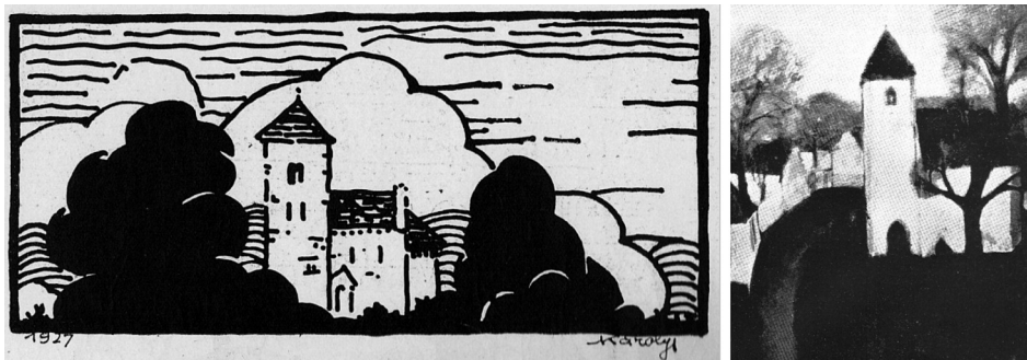
1. kép. Károlyi Antal (tus, papír) 1927; 2. kép. Hatos Csaba (tempera, farost) 1976

Az első ábrázolás alkotója a kopácsi születésű Ybl-díjas építész, Károlyi Antal (1906–70), akinek ez a grafikája a József Nádor Műszaki Egyetem Építészkarának Megfagyott Muzsikuskus című kiadványában jelent meg 1927-ben. 4 A Kós Károly grafikáit idéző posztszecessziós alkotás a templom déli homlokzatát ábrázolja a táji környezettel, erős dekorativitással, a vonalak, foltok hangsúlyozásával. A grafika hűen visszaadja a templom arányos és szép hármast (torony, hajó, szentély) tagolódását. A torony zömökebb a valóságánál, ettől kicsit várszerűvé válik az épület, ami a középkori templomaink esetében indokolt-