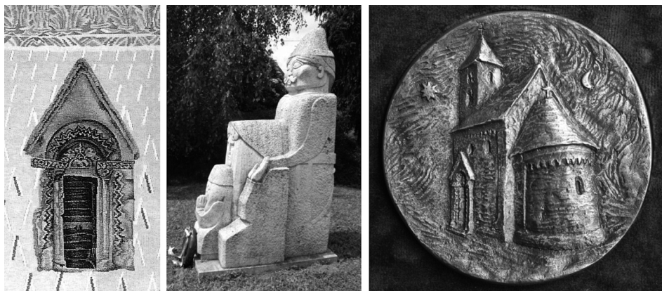
6. kép. Nagy Judit: Himnusz-kapuk (részlet); 7. kép. Módy Péter: Eleink (mészkö) 2000; 8. kép. Módy Péter: Csempeszkopács díszpolgára érme (bronz) 2006

Módy Péter egy másik munkájában, a „Csempeszkopács díszpolgára” érmén felhasználta a templom Agnus Dei kapudomborművének motívumát. A bárány körüli hármas karéj arányait kicsit átalakította. Az érme másik oldalán a templomot örökítette meg délkeleti oldalról. Az aranymetszésű épület aránya körformába foglalva a teljesség, a mindenség harmóniáját sugallja. Ezt a hatást még fokozza a Nap és Hold ábráival, ami már a Szentkorona keresztet tartó „pantokrátor” tűzzománc-ábrázolásán is megtalálható, de más családi címerekben és a székely zászlón is. 20 Az érme faktúrája szinte Vincent van Gogh festményeinek ecsetkezelését idézi, sőt az egész úgy hat, mintha az Auvers-i templomról készült festményének (1890) lenne egy dombormű-adaptációja.