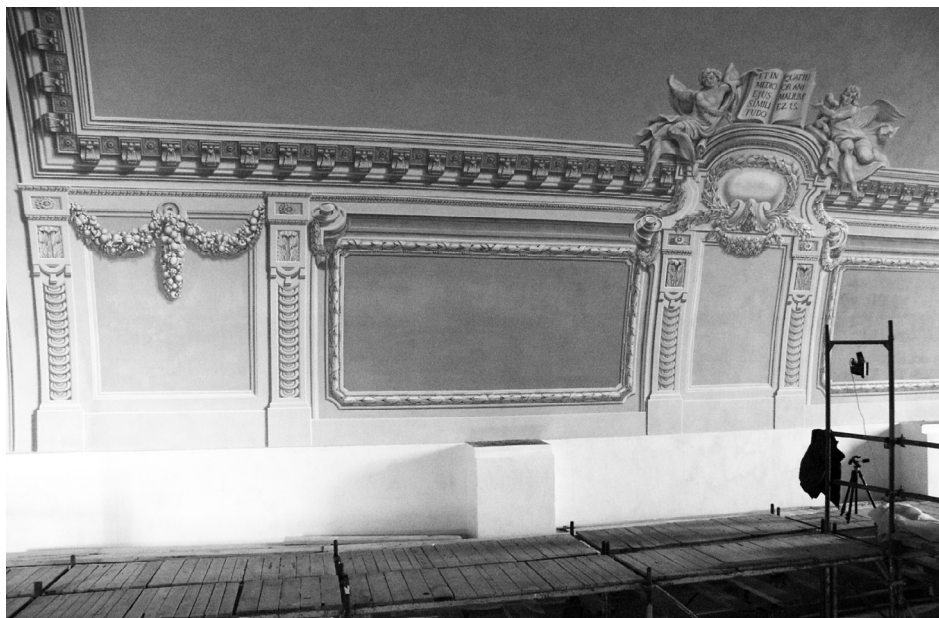
7. kép: Az elkészült dongaboltozati rekonstrukció részlete, állványbontás közben, 2003.