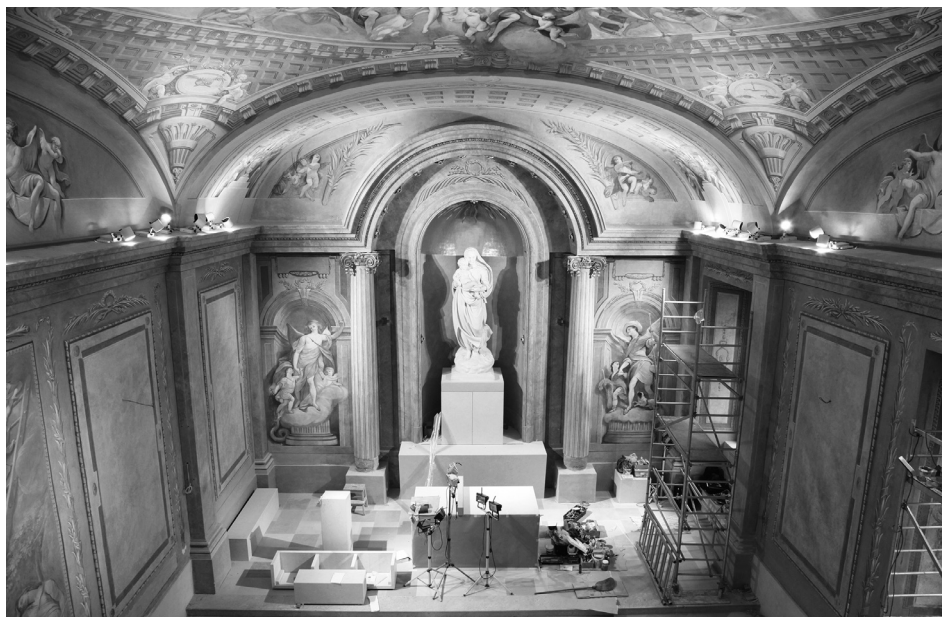
11. kép: A Madonna-kápolna a restaurálás utolsó hetében, 2015