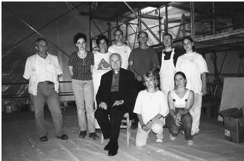
5. kép: Csoportkép a négyezeti kupola újrafestésének idején, középen dr. Konkoly István megyéspüspökkel, 2002