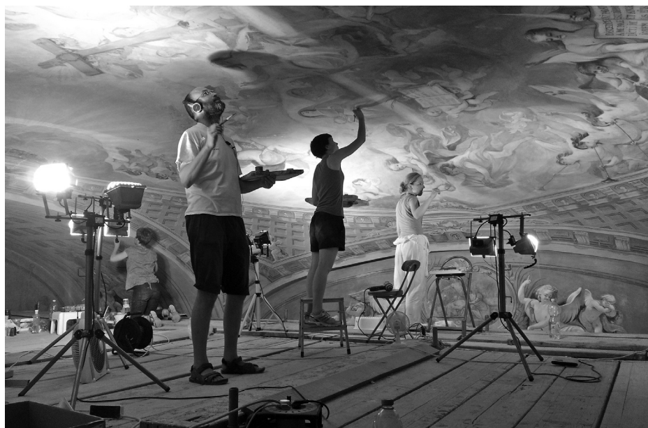
8. kép: Retusálás az Utolsó ítélet című falképen, a Madonna-kápolnában, 2015