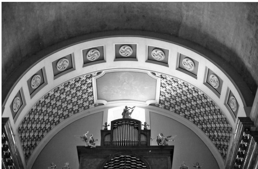
2. kép: A karzat látványa a Deák Klára-féle helyreállítás után, sosem létezett állapot, a beázásnak tartott grisaille-pannóval, 2001