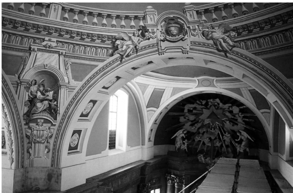
4. kép: A négyezeti kupola rekonstruált falképeinek részlete, állványbontás közben, 2002