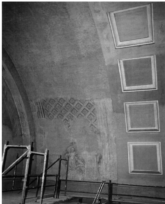
1. kép: A Szent Márton-kápolna dongaboltozatán lévő töredékes kifestés, amelyet tévesen neobarokk festésként írt le Deák Klára, holott eredeti barokk volt, 2000–2001