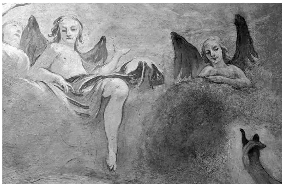
9–10. kép: Az angyal alakja a Madonna-kápolna középképén, 1977-ből, majd 2015-ből