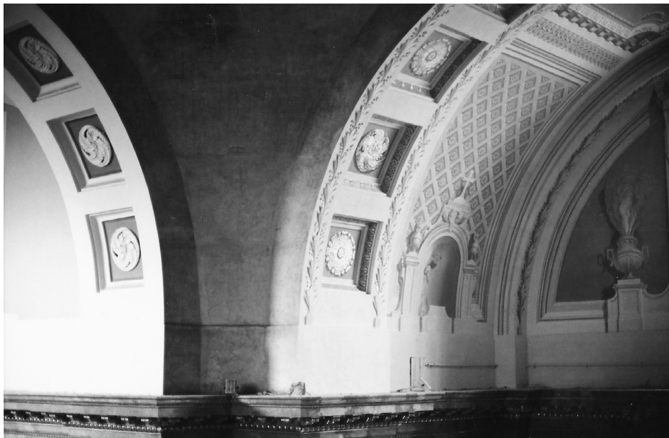
3. kép: A restaurált–rekonstruált falképek – Szent Márton-kápolna –, és a szentély részletének együttes látványa, 2001