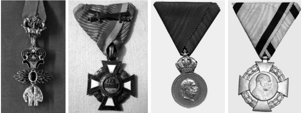
3–6. kép: Az érme előlapján látható kitüntetések rekonstrukciója

A 30 mm átmérőjű, 2 mm vastagságú és 12 gramm súlyú öntött érme előlapján IV. Károly az Aranygyapjas renddel és három kitüntetéssel ékesített – balról jobbra: Katonai Érdemkereszt hadidíszítményes III. osztálya, Bronz Katonai Érdemérem, Katonai Jubileumi Kereszt – tábornagyi egyenruhás, balra néző profil mellképe látható.