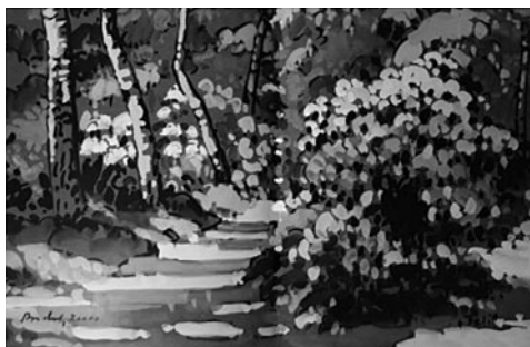
32–33. kép: Bodor Miklós: Jeli, 2006