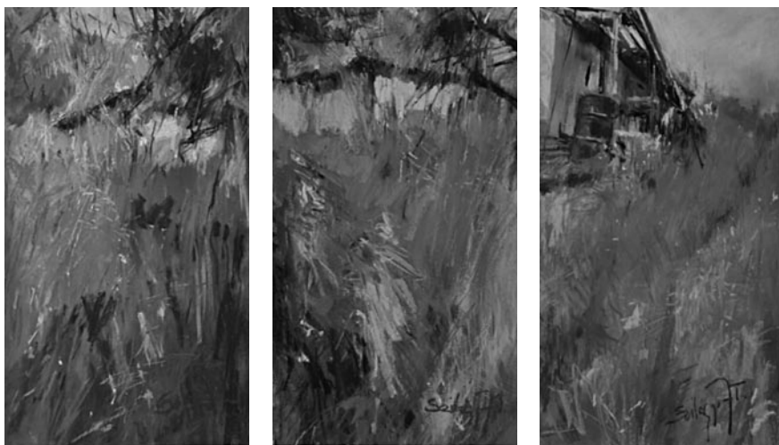
64–66. kép: Szilágyi Jéger Teréz: Hegyháti tető, Oszkó I–III., 2020