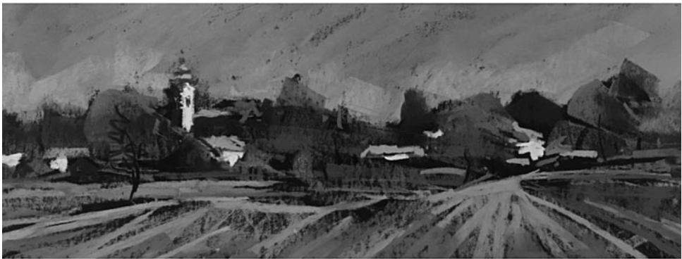
48. kép: Németh Ida: Győrvár, 2020