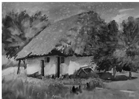
9–10. kép: Káldy Lajos: Petőmihályfa, 2002