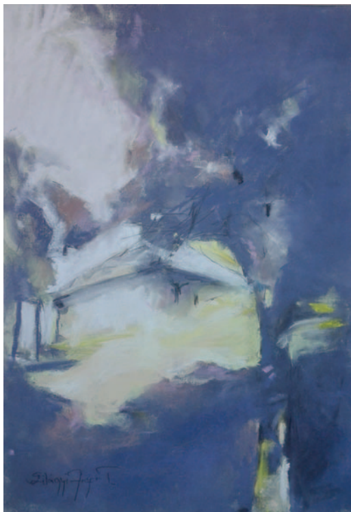
Szilágyi Jéger Teréz: Hajlék a hegyen, 2016