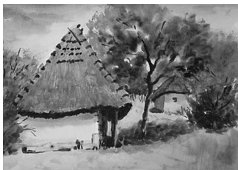
11. kép: Káldy Lajos: Csipkerek pincerom, 2002; 12. kép: Káldy Lajos: Tornácos pince, 2004