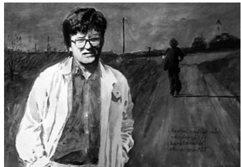
49. kép: Czanik Ferenc: Oszkó környéki bálák, 2015; 50. kép: Czanik Ferenc: Nagy Gáspár emlékére, 2016