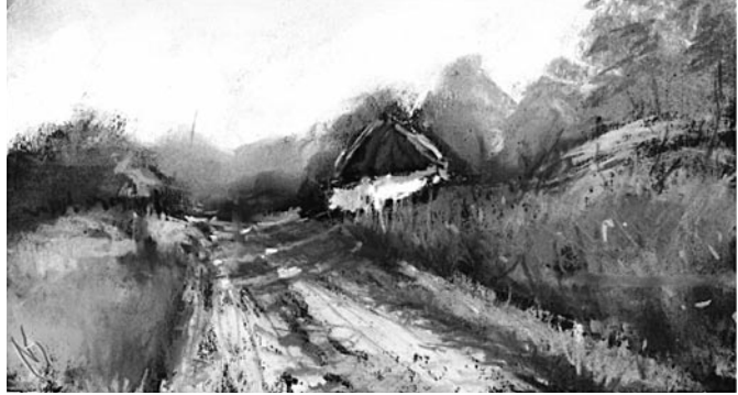
46. kép: Németh Ida: Sarki ház, Oszkó, 2015; 47. kép: Németh Ida: Út a pincékhez, Oszkó, 2015