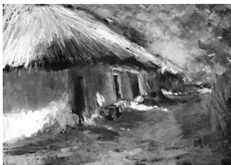
40. kép: Németh Ida: Magasles, Oszkó, 2016; 41. kép: Németh Ida: Pincesor, Oszkó, 2016