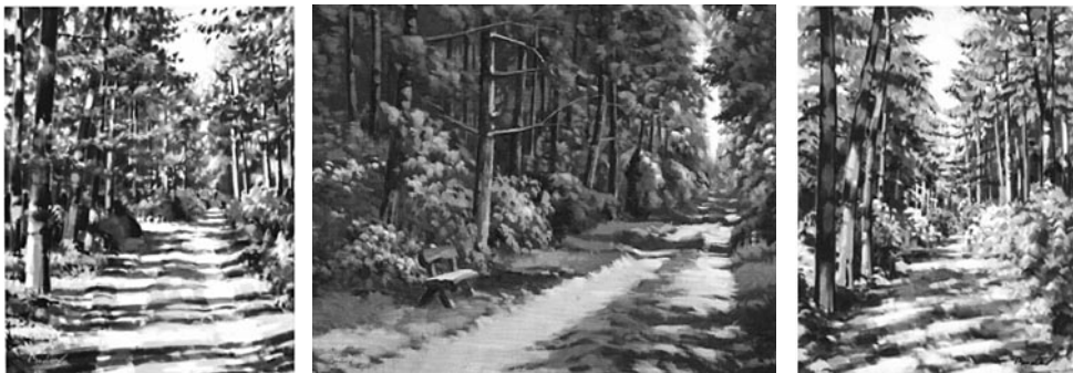
25. kép: Bodor Miklós: Jeli, 2002; 26–27. kép: Bodor Miklós: Jeli, 2004