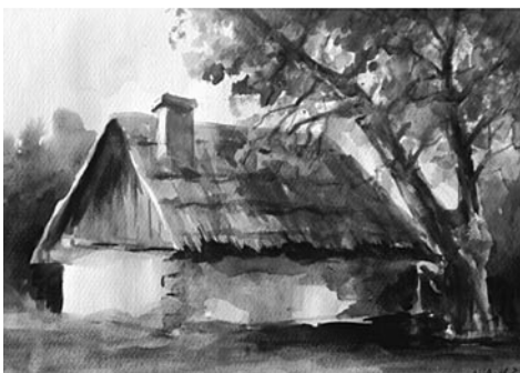
36. kép: Németh Pál: Oszkói pince, 2006; 37. kép: Németh Pál: Oszkói borospince, 2007