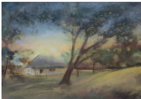
Czanik Ferenc: Alkonyat az oszkói pincéknél, 2015