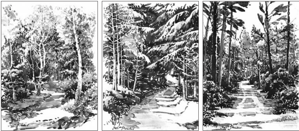
22–24. kép: Bodor Miklós: Jeli, 2002