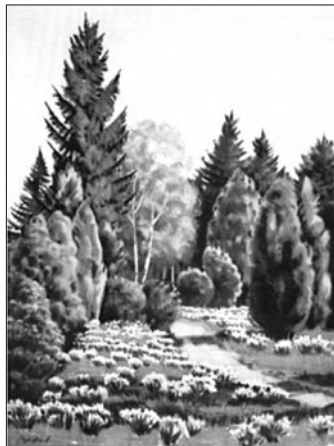
28. kép: Bodor Miklós: Jeli, 2004; 29. kép: Bodor Miklós: Jeli, 2006