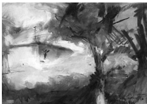
54. kép: Szilágyi Jéger Teréz: Hajlék VII. 2016; 55. kép: Szilágyi Jéger Teréz: Hajlék, Oszkói szőlőhegyen, 2016