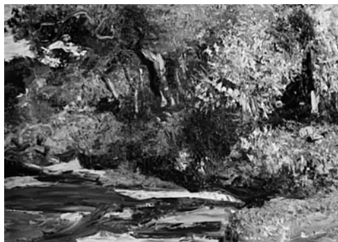
17. kép: Káldy Lajos: Petőmihályfa Istállós pince, 2008; 18. kép: Krieg Ferenc: Vízpart, 2001