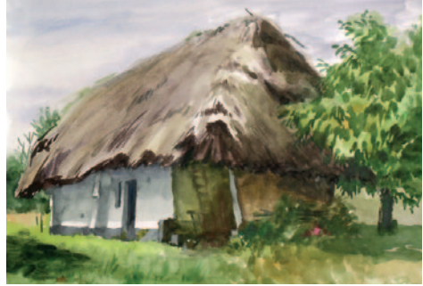
Káldy Lajos: Petőmihályfa Török pince, 2000