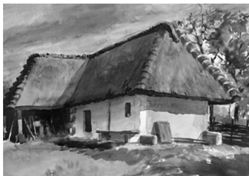
13. kép: Káldy Lajos: Csipkerek, 2005; 14. kép: Káldy Lajos: Petőmihályfai pince, 2005