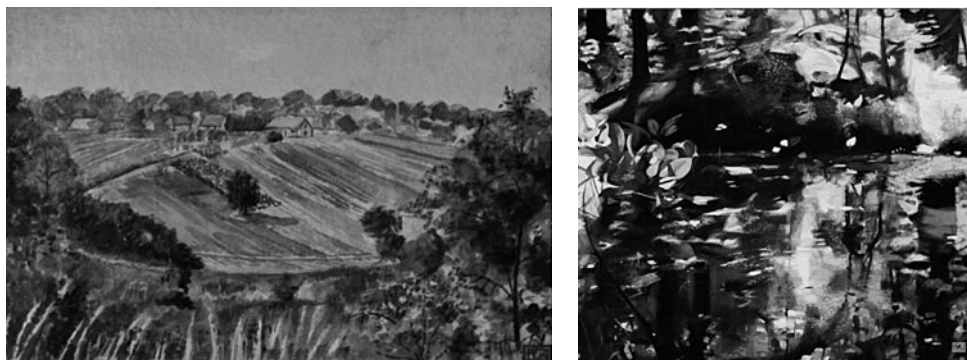
69. kép: Kovács Zsóka: Szőlőhegy a Hegyháton, 2006; 70. kép: Kovács Zsóka: Erdei tó, Oszkó, 2013