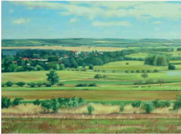
Kovács Zsóka: Oszkó, 2018