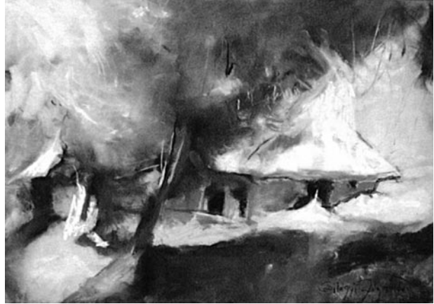
58. kép: Szilágyi Jéger Teréz: Hajlék, Hegyhát, 2016; 59. kép: Szilágyi Jéger Teréz: Hajlék II., 2016