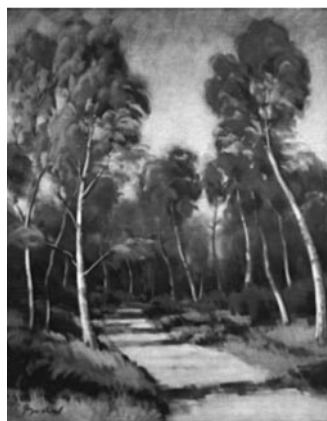
30–31. kép: Bodor Miklós: Jeli, 2006