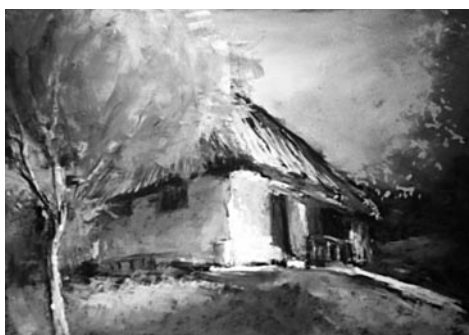
42. kép: Németh Ida: Oszkói utca, 2014; 43. kép: Németh Ida: Oszkói pince, 2014