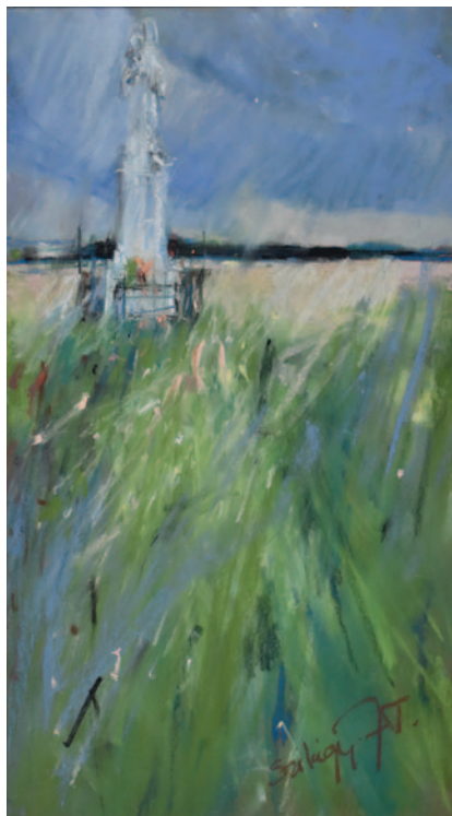
Szilágyi Jéger Teréz: Út mentén Vasvár felé, 2020