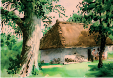
Káldy Lajos: Oszkói borospince gesztenyefái, 2008