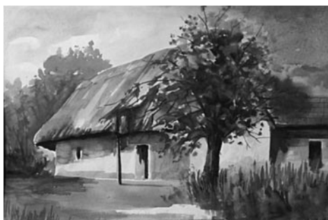
34. kép: Németh Pál: Zsuppos ház, 2004; 35. kép: Németh Pál: Egervölgyi prësház, 2006