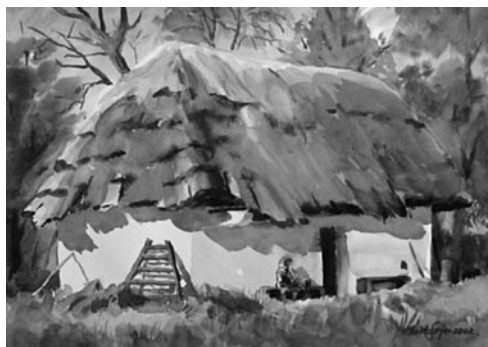
1. kép: Káldy Lajos: Döbörhegy, é. n.; 2. kép: Káldy Lajos: Oszkó, 2002