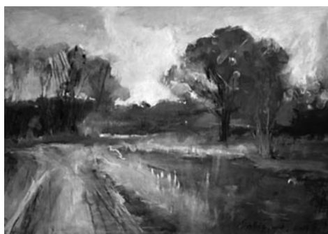
56. kép: Szilágyi Jéger Teréz: Poros út a hegy felé, Oszkó, 2016; 57. kép: Szilágyi Jéger Teréz: Poros út, Oszkó, 2016