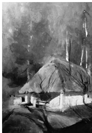
51–53. kép: Szilágyi Jéger Teréz: Szőlőhegy, Oszkó I–III., 2014