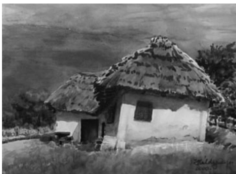
5. kép: Káldy Lajos: Petőmihályfa, 2000; 6. kép: Káldy Lajos: Petőmihályfa megsüllyedt pince, 2000