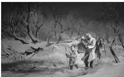
3. kép: Káldy Lajos: Csipkerekeli alvó borospincék, 2000; 4. kép: Káldy Lajos: Betlehemesek, é. n.