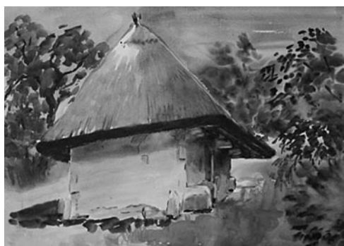
15. kép: Káldy Lajos: Oszkó Téglás István pincéje, 2008; 16. kép: Káldy Lajos: Oszkói talpas pince, 2008