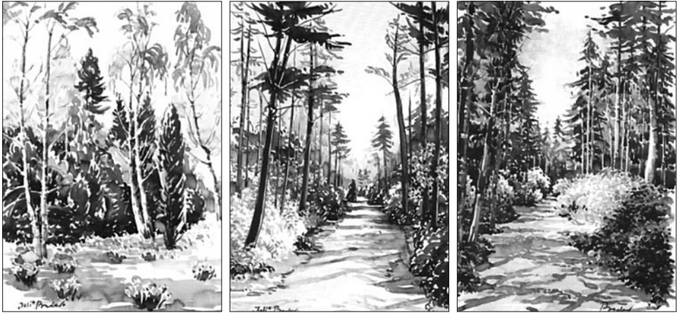
19–21. kép: Bodor Miklós: Jeli, 2002