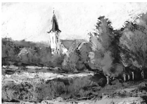
44. kép: Németh Ida: Máriás ház, Oszkó, 2014; 45. kép: Németh Ida: Falu szélén, Oszkó, 2015