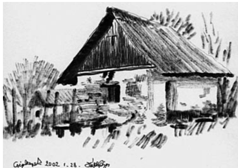
7. kép: Káldy Lajos: Petőmihályfa, 2001; 8. kép: Káldy Lajos: Csipkerek, 2002