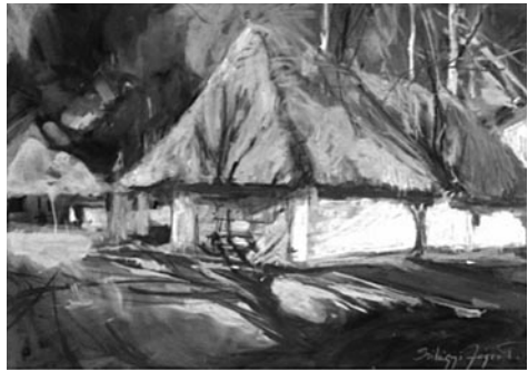
60–61. kép: Szilágyi Jéger Teréz: Hajlék IV–V., 2016