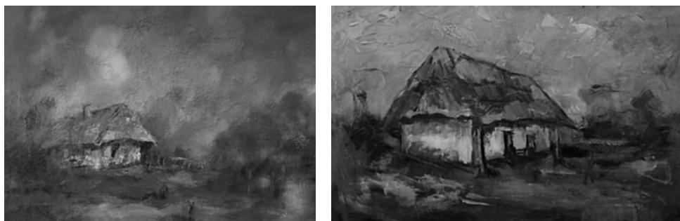
67–68. kép: Murányi Teréz: Oszkói pince, 2016