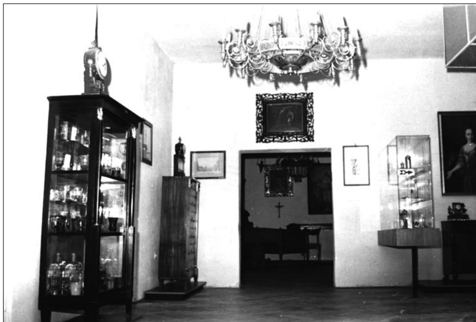
2. kép: A Smidt Múzeum első, állandó kiállításáról – empire szobájából a barokk terem felé – készített felvétel