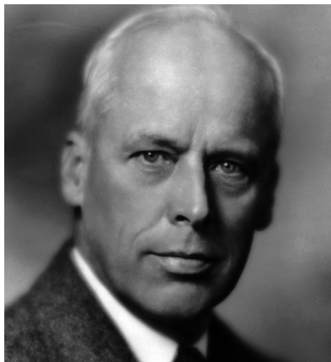
Norman Thomas ( https://www.newworldencyclopedia.org/entry/Norman_Thomas Megtekintve: 2021. szeptember 3.)