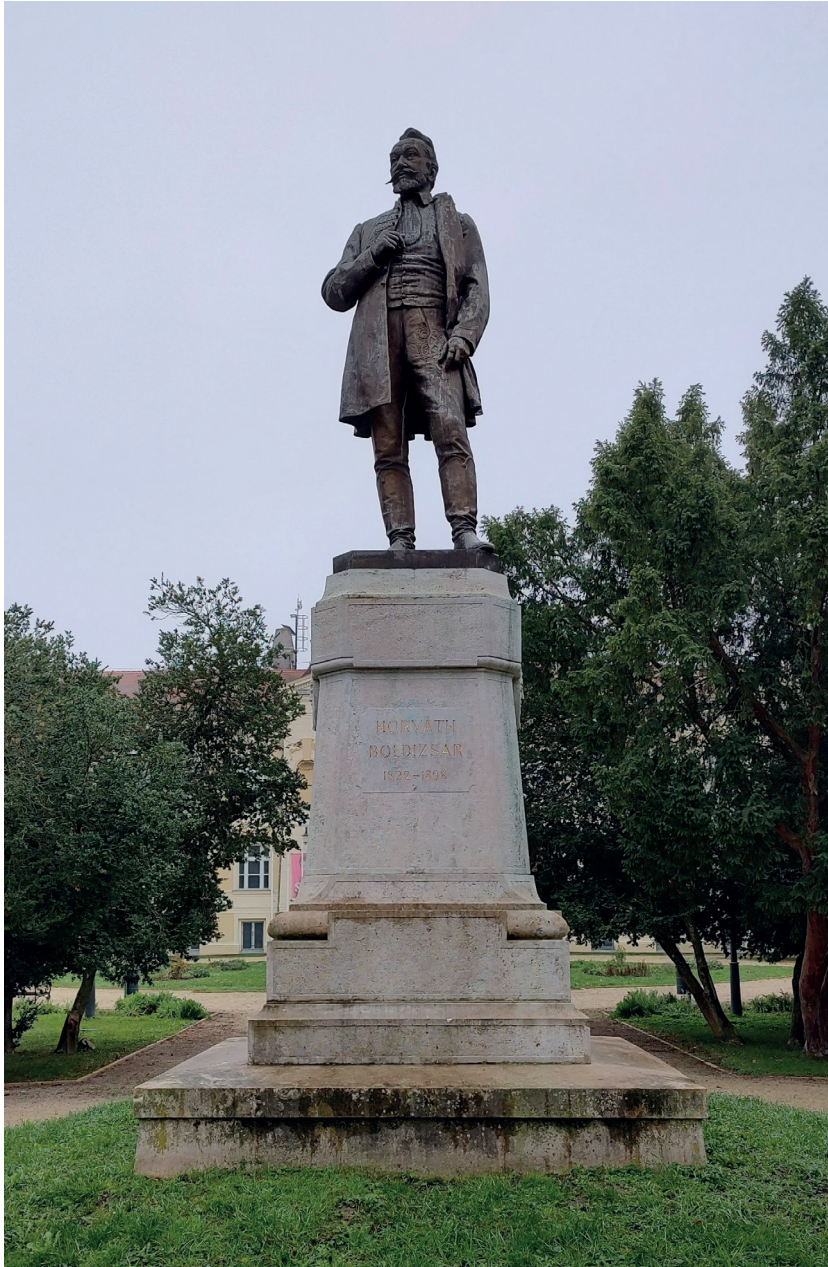
Tóth István: Horváth Boldizsár szobra