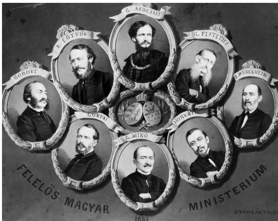
Veress Ferenc: Felelős magyar ministerium, 1867

1866-ban a majdani kiegyezés egyik legkiemelkedőbb előkészítőjeként mutatta be a vezércikk: „Az országgyűlés, mely két feliratában a nemzet óhajtságának kifejezést adott a közjogi kérdésben, jelenleg azon pont-hoz jutott, melyben a nyilvános tárgyalásoktól némileg visszavonulva, összes rendezetlen viszonyaink minden kérdésében bizottsági részletes munkálatokkal kell foglalkoznia, hogy a nemzetnek állandó és szerencsés jövőt s szabad politikai fejlődést biztosítson. E bizottságok egyik legnevezetesebbike a »kódifikációval« (törvénykönyv szerkesztésével) van megbízva, s a nemzet törvényhozására váró e munka terén alig várhatunk többet valakitől, mint azon férfitól, kinek arcz-