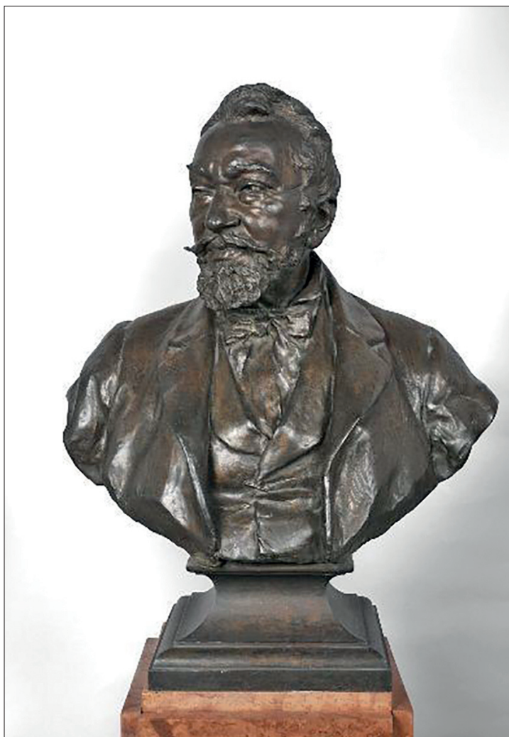
Zala György: Horváth Boldizsár mellszobra (MNG ltsz.: 52.165.)