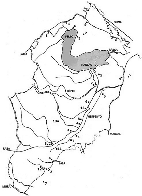
Speculatorok, besenyők és a Rába-erdő Jelölés: (háromszög) – speculator; (rombusz) – besenyő telep; (négyzet) – Rába-erdő

Egy 1313. évi jelentés a Rába-erdő rumi hídja közelében lévő vadászatról és hatalmaskodásról tudósít. A Rába-erdőhöz tartozó földek használatának felügyelete a vas-