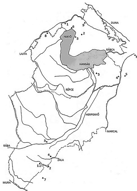
Speculatorok és besenyők a Nyugat-Dunántúlon Jelölés: (háromszög) – speculator; (rombusz) – besenyő telep