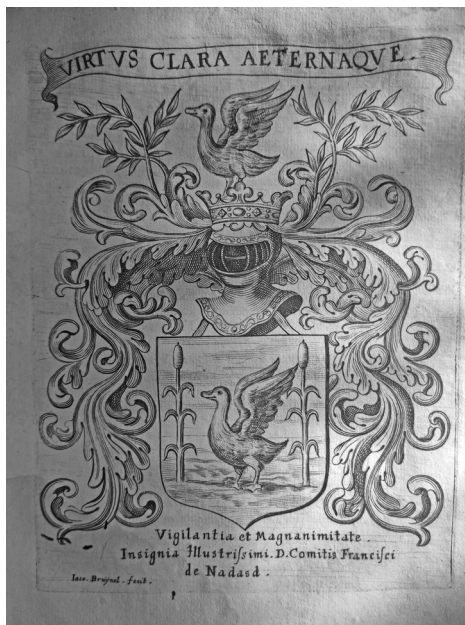
A könyvben található egyik Nádasdy-exlibris

A mű keletkezése, tartalma és utóélete is rendkívül érdekes, azt részletesen mutatja be a lehető legrészletesebb forrás: az ismeretlen szerzőkről, a metszetek művészi színvonaláról, a szöveg ideológiájáról szól Rózsa György „Magyar történetábrázolás a 17. században” című műve. 37 A könyvben a címlapon kívül 59 metszet található. 14 a Szent István király előtti ve-