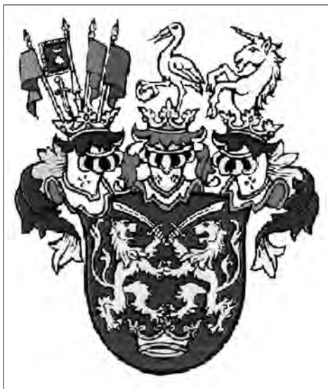
A Festetics család címere