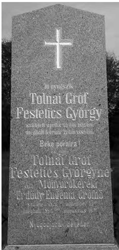
Festetics (II.) György és feleségének felújított síremléke a püspökmolnári temetőben

tésével – sorfalat álltak, a szenttamási dalárda pedig gyászdalokat énekelt. 37