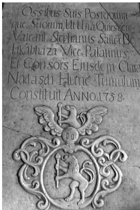
A Sallér család kriptája a szenttamási templomban