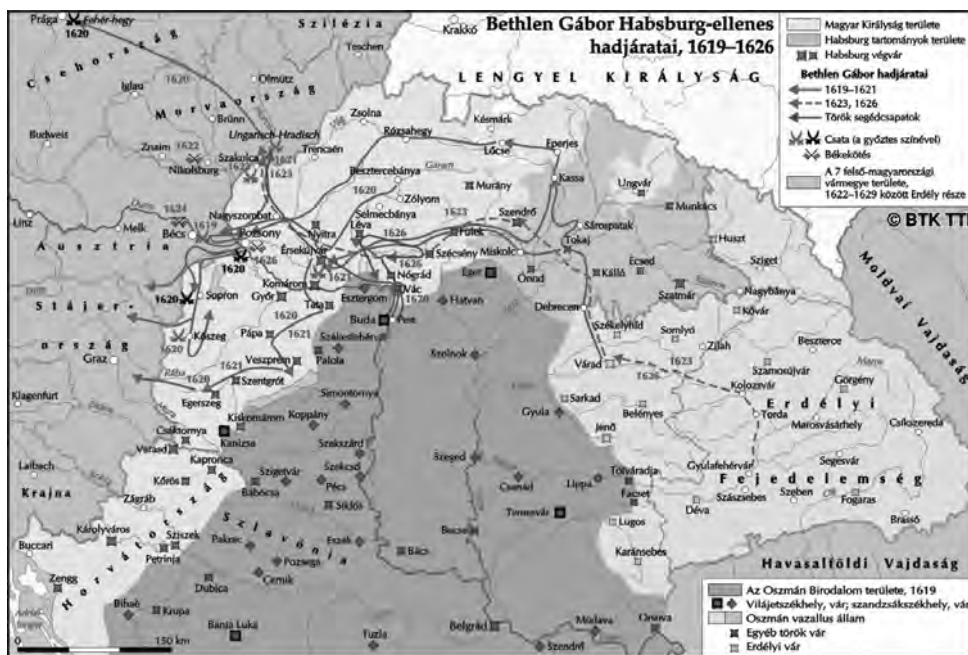
Térkép Bethlen hadmozdulatairól a 30 éves háború első éveiben.

( https://tti.abtk.hu/terkepek/terkepek/1619-1626-bethlen-gabor-habsburg-ellenes-hadjaratai )