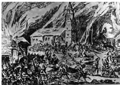
Csepreg pusztulása 1621-ben. Zichy Nándor másolata „az Országos Képtár metszetyűjteményében levő eredeti után” 112

A kegyetlen fosztogatás és bujálkodás három nap és három éjjel tartott. Közben „bor, búza és barom juta mind prédára”. 110 Zinner levele szerint a hadjárat során körülbelül 5000 darab marhát elhajtottak, ezeket az ezredek között szétosztották. 111