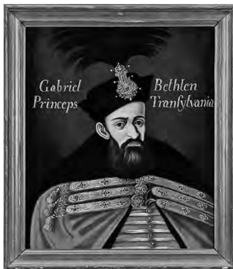
Bethlen Gábor

Bethlen Gábor hada Felső- és Alsó-Magyarországon csekély ellenállásba ütközött. A főurak, a várak és a városok többsége melléállt, október 15-én a pozsonyi vár is megnyitotta kapuit a fejedelem előtt. Bethlen csapatai október 26-án egyesültek a Prága közeléből előrenyomuló, a visszavonuló császáriakat üldöző cseh–morva–sziléziai hadakkal. A jelentős létszámú sereg november végére körülvárta az addigra alaposan megerősített Bécset. A fejedelem néhány napi csatározás után – Homonnai Drugeth Bálint Felső-Magyarországra támadása és Rákóczi György veresége hírére – Alsó-Ausztrián keresztül Nyugat-Magyarországra vonult.