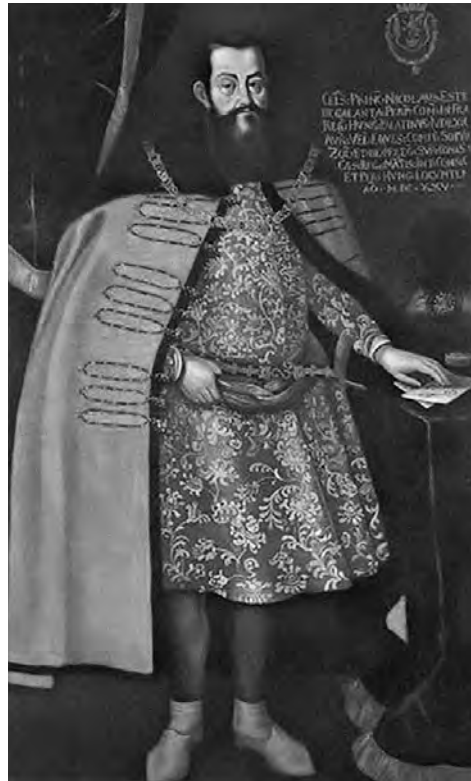
Esterházy Miklós

II. Ferdinánd császár 1620. december 11-én Esterházy Miklóst magyarországi főbiztosának nevezte ki „a lázadók kicsapongásainak lecsillapítására és fékezésére (...) Hatalmat adván neki az irántunk való en-