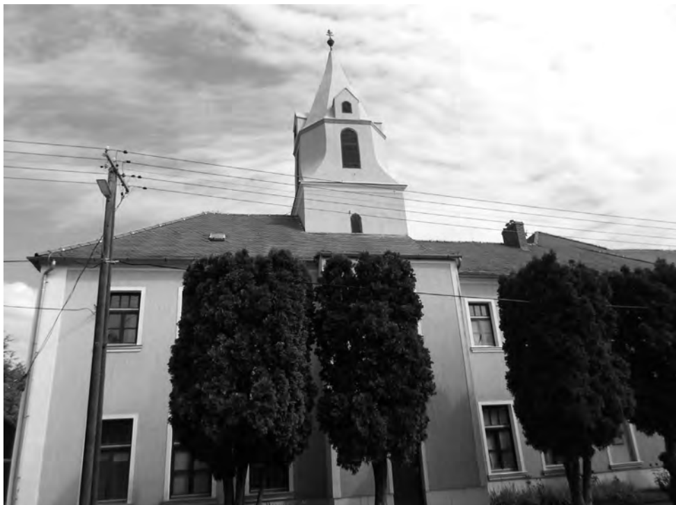
A Szent Katalin (alsó) -templom ma