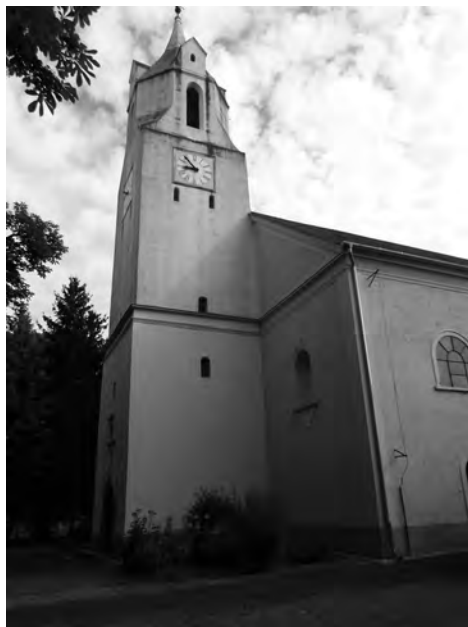
Fotó a felső templom tornyáról, melyen ma is megvannak a lőrések helyei