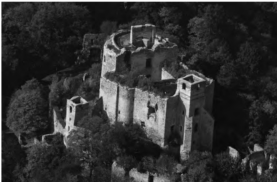
A lánzséri vár ma ( https://varlexikon.hu/lanzser ) 142

s a deák arra gondolt az idézett sorok leírásakor.