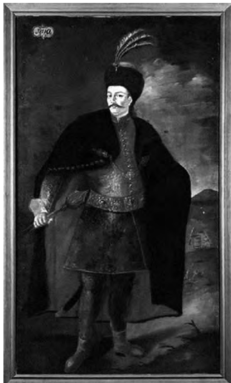
Batthyány II. Ferenc

A fontosabb főúri várak és egyben uradalmi központok a Batthyány-birtokon: Körmend, Németújvár (ma Güssing, Ausztria), Rohonc (ma Rechnitz, Ausztria) és Szalónak (ma Stadtschlaining, Ausztria), a Nádasdy-birtokon: Kapuvár, Léka, Sárvár és Sopronkeresztúr településen helyezkedtek el. Mindegyik jól erődített és megfelelő őrséggel rendelkezett. A főúri bándériumok nagyobb része Németújváron, illetve Sárváron és a közeli településeken állomásozott.