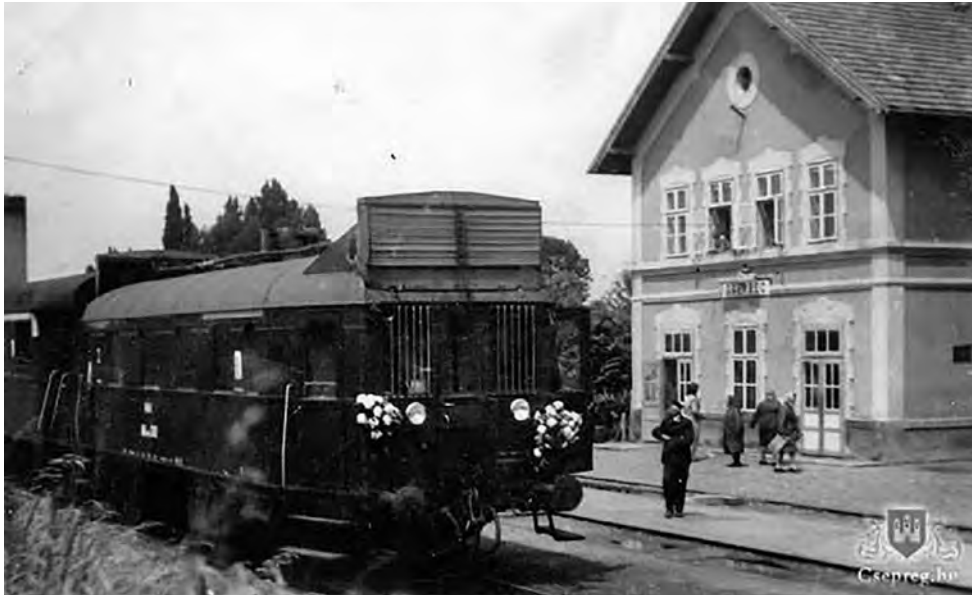
6. kép. A felvirágozott vonat Csepreg állomáson

Még egy érdekesség, melyre többen személyesen is emlékeznek: