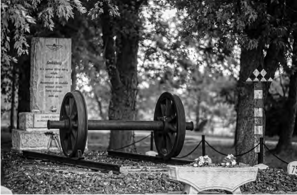
7. kép. Az emlékmű felirata: „Emlékhely – Ez a vasútvonal 1913-tól 1974-ig szolgálta Csepreget és környékét. Megszűnésének 30. évfordulóján emlékezésül állította Csepreg vasutassága 2004-ben.”