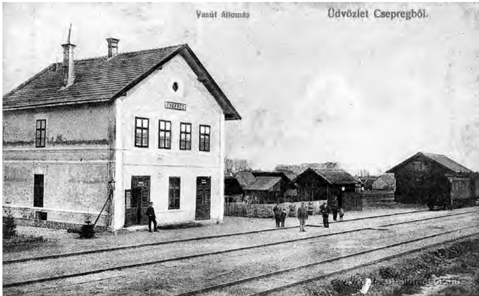
3. kép. Csepreg vasútállomása egy korabeli képes levelezőlapon

mindkét irányban 300 m-re a nyílt pályát elsőrendű felépítménnyel építhették. Bajtiban a Sárvár felőli oldalon, Káldon, Bőben és Locsmádon a raktári vágányból csonkavágány létesítésére kötelezték az építetőt. A talpfák alapanyaga tölgy- vagy bükkfa, az ágyazatba homokot és kavicsot építhettek fele-fele arányban. A vonal mentén táviróoszlopokat állítottak és vezetéket húztak ki Lajosmajorban (ma Káld–Szitamajor), „Lajos rakodó” néven rakodót létesítettek. Két helyen bányavágány is épült, a már említett Hosszúperesztegen, valamint Sitkén. Az okirat szerint kizárólag a hazai vasipar termékeit használhatja a társaság. Csak a következő évben épült meg Zalaebénnél a deltavágány, így a vonat közvetlenül tudott Zalabér és Túrje állomások felé bejárni. Addig Batyk kitérőnél a vonatok Zalaegerszeg felé tértek, mivel a zalai megveszék hely volt a vonal egyik végállomása.