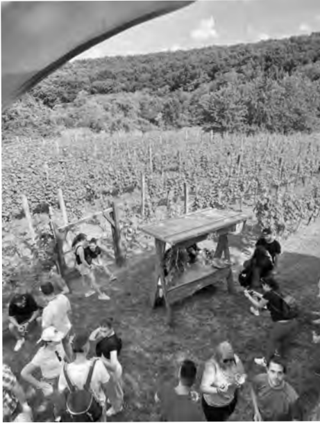
2. kép. Nyitott pincék a csepregi szőlőhegyen, 2024