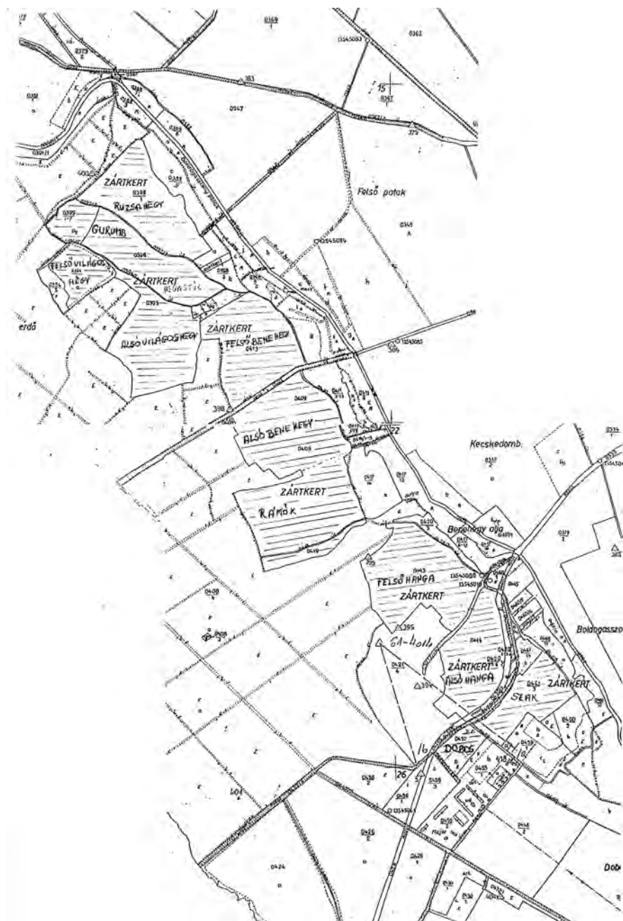
1. sz. melléklet. Művelési ágak szerinti megoszlás a szőlőhegyen.