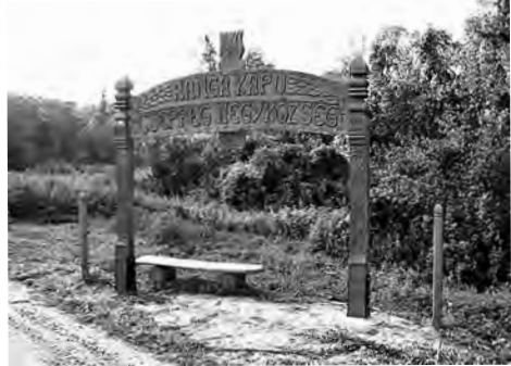
3. kép. A szőlőhegy bejárata, a Hangakapu